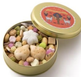
中川政七商店 [4F] 吹き寄せお菓子缶