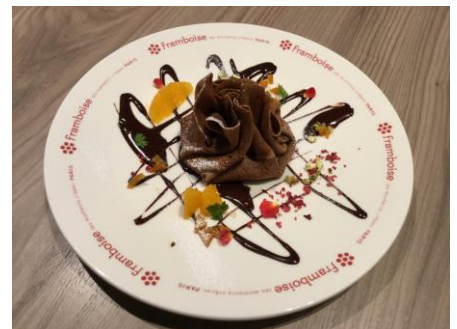
framboise [3F] オモニエール・ノワール