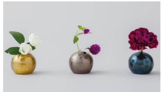
玉川堂 [4F] フラワーボール