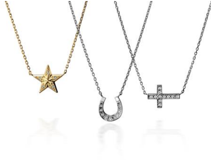
SJX [5F] ダイヤモンドモチーフネックレス