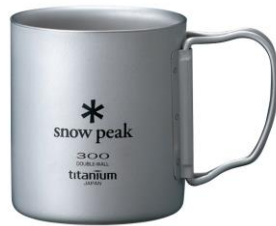
snow peak MOBILE [5F] チタンダブルマグ