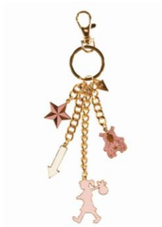
KAREN WALKER [3F] キーチャーム