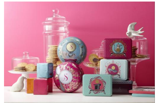
#0107 PLAZA [4F] La Sablésienne