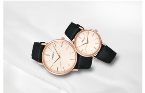
SEIKO Boutique [5F] セイコー ゴールドフェザー デザイン 復刻モデル SCXP086