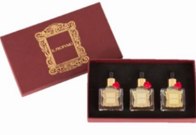
La Maison VALMONT [B1F] IL PROFVMO ホワイトデー限定キット