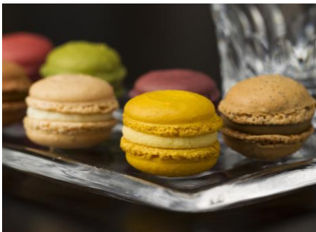
il Cardinale [6F] マカロン