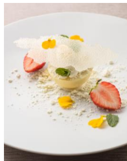
THE GRAND GINZA [13F] イチゴと蜂蜜のパルフェ ホワイトチョコとのマリアーージュ