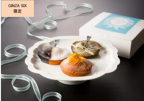
しっとりマドレーヌ 3個セット (Viennoiserie JEAN FRANCOIS) 価格:800円

※ギルトフリー：“身体に良い素材”や“低糖質・低カロリー”など、「罪悪感ゼロ」で楽しむことができる注目のフード