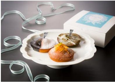
しっとりマドレーヌ 3個セット (Viennoiserie JEAN FRANCOIS)