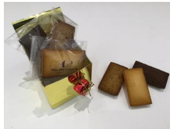
フィナンシェ ギフトボックス 3個入 (PHILIPPE CONTICINI)