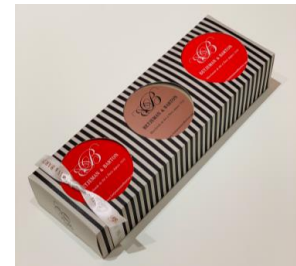
ホワイトデーセレクション 3缶セット (BETJEMAN & BARTON)

※上記は一例。各テーマのピックアップ商品は次項以降を参照 ※各店舗のメニュー・フード詳細および販売期間は、 別紙「ホワイトデーのおすすめメニュー・商品リスト」参照