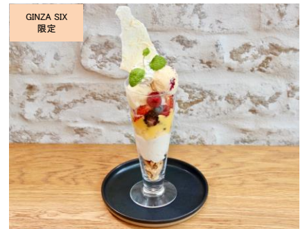
パッションフルーツとメレンゲのパフェ (72Degrees Juicery + café by David Myers) 価格:1,680円

果物専門店ならではの、果物とチョコレートが融合したボンボンショコラ。GINZA SIX 店限定のりんごと栗、人気のメロン、柚子ヘーゼル、オレンジ、パッションフルーツの6種詰め合わせ。口に入れた瞬間に広がる、果物とカカオの表情豊かな味わいをお楽しみください。