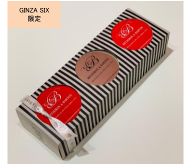
ホワイトデーセレクション 3 缶セット (BETJEMAN & BARTON)