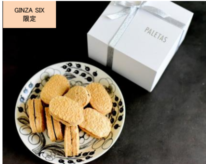
Dacquoise Assoties Set (PALETAS)

日本や世界の名店が軒を連ねる GINZA SIX では、パティシエのこだわりが随所にちりばめられた GINZA SIX 限定のスイーツが数多く揃います。他では手に入らない“GINZA SIX クオリティ”のプレミアムなラインナップは、周りに差をつけたいバレンタインのお返しギフトに最適です。