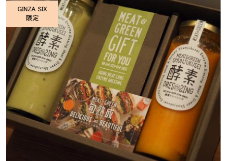
酵素ドレッシングのアソートボックス (meat & green 旬熟成) 価格:2,500円(2本セット)

あまおうそのものから作ったお酢に果汁とはちみつのみを加えた、ギルトフリーで健康的な飲む酢です。