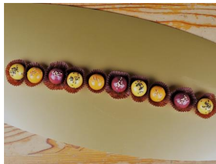
カラー芋 (南風農菓舎・デザートハウス)