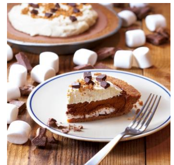
S'MORE PIE (The Pie Hole Los Angeles)