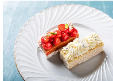
ベリーベリー ※画像左 (パティスリー パプロフ)