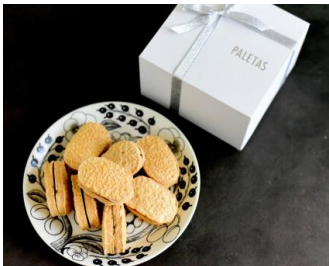
Dacquoise Assoties Set (PALETAS)