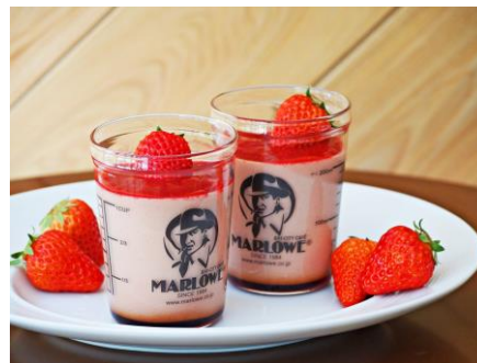
ストロベリーチーズプリン (マーロウ)