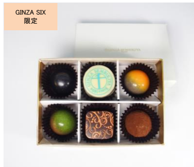
GINZA SIX 店限定ショコラ 6個 (パティスリー 銀座千疋屋) 価格:2,500円

果物専門店ならではの、果物とチョコレートが融合したボンボンショコラ。GINZA SIX 店限定のりんごと栗、人気のメロン、柚子ヘーゼル、オレンジ、パッションフルーツの6種詰め合わせ。口に入れた瞬間に広がる、果物とカカオの表情豊かな味わいをお楽しみください。