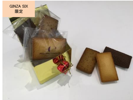
フィナンシェ ギフトボックス(3 個入り) (PHILIPPE CONTICINI)