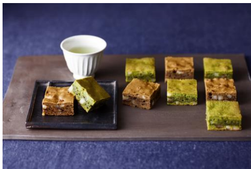
京濃い茶とほうじ茶のブラウニー9 個入 (辻利)