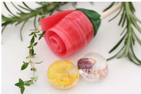
フラスワーツセット (PAPABUBBLE)