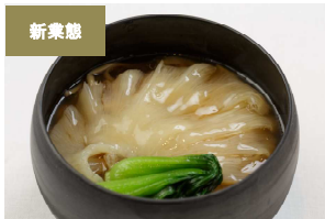
自由が丘蔭山樓 (ジユウガオカカゲヤマロウ)

東京・自由が丘にて、フカヒレ料理とらーめんを2本柱とする蔭山樓の、フカヒレを主体とした新業態。