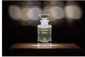
FUEGUIA 1833 Ginza (フエギア イチハチサンサン ギンザ)

フランス・パリのオペラ座に認められ、数々のアワードを受賞し、常に最新かつ最高峰の音響体験を追い続けるDEVIALET。そのクオリティーから海外の著名アーティストのファンも多い。デビアレブティックでは各種イベントを開催。「聴く」から「体感する」経験を。専門知識を持つコンシェルジュが一步先のライフスタイルを提案します。