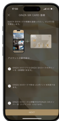
JFRカード発行GINZA SIXカード