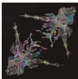
OKANO 商品名:「美しい羽 02 GINZA MADARA」 価格:マスターピース 1,280,000 円 エディション 280,000 円

サイズ:W250×H190×D90mm 素材:クロダイルレザー カラー展開:全 10 色