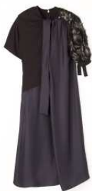
Maison Margiela 商品名:エンプロイダリードレス 価格:292,000 円

わずか 1mm 厚のムーブメントを内包する、世界最薄の光発電時計。限定セットには、つややかで風格のあるデジュー革の替えバンドをセットし、朱色の漆の箱で提供いたします。