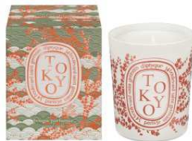
diptyque 商品名:フレグランスキャンドル Tokyo 価格:未定

最高の気分になれる「ルージュ デオリアル」より、キンザからインスピレーションをうけた限定品が誕生します。 ※写真右下