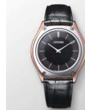
CITIZEN FLAGSHIP STORE TOKYO 商品名:Eco-Drive One CITIZEN FLAGSHIP STORE TOKYO 限定セット 価格:750,000 円

サイズ:メンズ XS~XL レディース XS~XL 素材:コットン100% カラー展開:ブラック