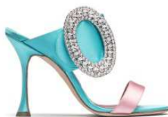
MANOLO BLAHNIK 商品名:FIBIONABI 価格:133,000 円

スワロフスキーを贅沢に使った大きいオーバル状のバックルが足元を美しく輝かせます。19 世紀後半に活躍した世界で最初のオートクチュール・デザイナー「チャールズ・ワース」からインスピレーションされた、ラグジュアリーファッションシューズと呼ぶにふさわしい一足です。