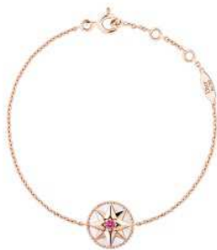
House of Dior Ginza 「Rose des Vents (ローズ デ ヴァン)」

中央通りに並ぶ路面 6 店舗(House of Dior Ginza、CÉLINE、SAINT LAURENT、Van Cleef & Arpels、VALENTINO、FENDI)では、ラグジュアリーで個性溢れる GINZA SIX 特別商品を展開します。世界最大級のコレクションを展開するシチズン、創業 120 年の着物製作所 OKANO、新潟燕三条の鋳起銅器専門店 玉川堂などでは、老舗ブランドならではの匠の技と「銀座」をかけあわせた、モダンかつ品格高い特別商品を販売します。また、フランススイーツ界の巨匠 フィリップ・コンティチーニ氏や、人気シェフの高澤義明氏は、それぞれの店で、世界中の美食家を魅了するグルメを販売するなど、各店渾身の特別商品が多数出揃い、GINZA SIX 開業を盛り上げます。