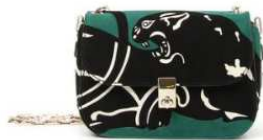
VALENTINO 商品名:VALENTINO GARAVANI パンサーチェーンストラップ付バッグ 価格:340,000 円

ヴァン クリーフ & アーペル GINZA SIX 店ではオープンを祝い、グラフィカルなデザインの「ブトン ドール」コレクションより新たな素材を用いた作品を世界の他店に先駆けて先行発売いたします。優美なピンクゴールドと透明感のあるホワイトゴールドの組み合わせが、永遠のエleganceに満ちた二重奏を奏でます。 素材:ピンクゴールド、ホワイトゴールド、ダイヤモンド