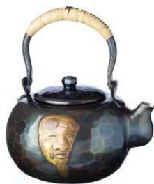
玉川堂 湯沸 口打出 翁面(2.7L)