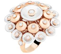
Van Cleef & Arpels 商品名:ブトン ドール リング 価格:2,250,000 円

新クリエイティブ・ディレクター アンソニー・ヴァカロと親交の深い、モデルの ANJA RUBIK が名前の由来となっています。 サイズ:W17.5×H19×D15.5cm