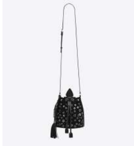
SAINT LAURENT 商品名:ANJA(アニア) 価格:235,000 円

風配図とムッシュ・ティオールが持ち歩いていたラッキースター、彼が愛した薔薇を重ね合わせたデザイン。風が人生を正しい方向へ導いてくれる“ローズ デ ヴァン”は身につけたいお守りジュエリーです。 素材:ピンクゴールド、ピンクサファイヤ、マザーオブパール