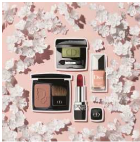
Dior BEAUTY GINZA 商品名:ルージュデオリアル#872 "GINZA" 価格:4,200 円

最高の気分になれる「ルージュ デオリアル」より、キンザからインスピレーションをうけた限定品が誕生します。 ※写真右下