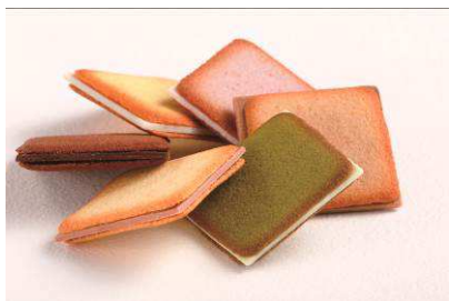
ISHIYA GINZA 商品名:SAQU LANGUES DE CHAT (サク ラング・ド・シャ) 価格:1,200 円

北海道で培われたラング・ド・シャ製造の技術を活かし、「銀座の手土産」にふさわしいラング・ド・シャとチョコレートとの組合せを厳選した「SAQU」シリーズ。北海道チーズ、北海道赤ワインなど、6種類をご用意しました。 内容量:12 枚入り