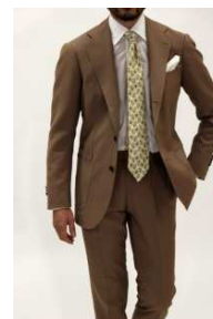
RING JACKET MEISTER GINZA 商品名:RING JACKET MEISTER206 英国 VINTAGE FABRIC スーツ 価格:250,000 円

1954 年に大阪で創業した高品質なメンズクロージングを展開する RING JACKET。既製品では取り入れられない上着上衿の後かぶせ工程によって極上の着用感を実現。