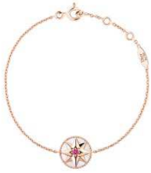
House of Dior Ginza 商品名:プレスレット 「Rose des Vents (ローズ デ ヴァン)」 価格:190,000 円

風配図とムッシュ・ティオールが持ち歩いていたラッキースター、彼が愛した薔薇を重ね合わせたデザイン。風が人生を正しい方向へ導いてくれる“ローズ デ ヴァン”は身につけたいお守りジュエリーです。 素材:ピンクゴールド、ピンクサファイヤ、マザーオブパール