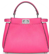
FENDI 商品名:セレリア ミニ ビーカブー 価格:530,000 円

ヴァレンティノの、RTW コレクションに登場する”パンサー”は、ハンドバッグをはじめ、さまざまなシーズナルスタイルに取り入れられています。このパターンには、レザーアプリケーション、レザープリント、インレイ、エンボイタリーといった異なるテクニックが用いられています。 サイズ:H15×W22×D8.5cm 素材:カーフ、スエード、ホニースキン、パイソンなど カラー展開:EMERALD