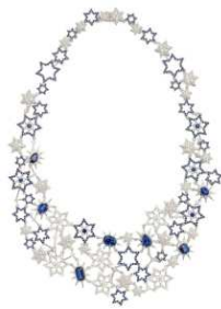
Bijou de M 商品名:Blue Stars Necklace 価格:16,000,000 円(予定)

夜空の輝く星たちをそのままネックレスにしたアイテム。光り輝く星空をブルーサファイアとダイヤモンドを贅沢に使用して表現しています。