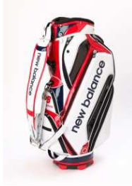
the HOUSE 商品名:<NEW BALANCE>"TOUR CADDIE BAG" GINZA SIX LIMITED EDITION 価格:52,000 円

新潟県無形文化財に指定されている鑄起銅器(ついきどうき)の技術を駆使した作品。GINZA SIX内に能楽堂が完成することを縁とし、伝統芸能と伝統工芸の融合を表現しました。 サイズ:胴高 17×胴張 20.5cm 素材:銅