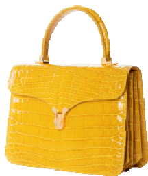
KWANPEN 商品名:折り紙ハンドバッグ 価格:700,000 円(予定)

サイズ:メンズ 44,46,48,50 素材:モヘア×ウール カラー展開:バーージュのみ