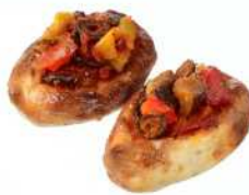
TAKAZAWA 180 ICHI HACHI MARU 商品名:バイクンコロッケ ～季節の野菜のラタトゥイユ～ 価格:400 円～※季節により変動

フランスの伝統菓子「クイニー・アマン」と「タルトタン」をかけ合わせました。バターと砂糖で煮詰めたりんごをバターをたっぷり織り込んだブリオッシュフィユテで包み、カラムルでコーティングしました。