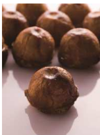
PHILIPPE CONTICINI 商品名:クイニー・タタン 価格:450 円

フランスの伝統菓子「クイニー・アマン」と「タルトタン」をかけ合わせました。バターと砂糖で煮詰めたりんごをバターをたっぷり織り込んだブリオッシュフィユテで包み、カラムルでコーティングしました。