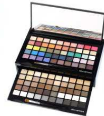
shu uemura 商品名:100色 アイシャドー パレット 価格:未定

日本庭園からインスピレーションを受け調和と静けさのバランスが絶妙なアイテム。近くの神社からの香りが落ち着きを与えてくれるヒノキの木陰の散歩を連想させるキャンドルです。 内容量:190g