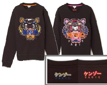
KENZO 商品名:タイガースウェット 価格:36,000 円

素材:・K18WG ・サファイア 23.10ct ・ダイヤモンド 10.96ct