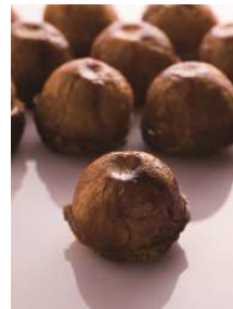
PHILIPPE CONTICINI クイニー・タタン

※特別商品のラインナップは次頁以降および別紙資料をご覧ください。価格は全て税抜です。 ※販売数量、販売方法等の詳細は各ブランドにお問い合わせください。 ※レストランの限定メニュー/特別メニューは3月中旬にリリース配信予定です。 ※記載情報は2017年2月14日時点の情報です。発売までに情報が変更される場合がございます。