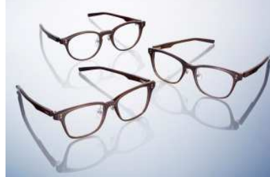
Four Nines 商品名:GINZA SIX オープニングモデル バッファローホーンフレーム 価格:170,000 円(予定)

天然素材のバッファローホーンを使用した GINZA SIX オープニングモデル。「逆 R ヒンジ」など独自の高い機能性を活かしたつくりで、上品さも楽しめます。