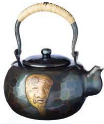
玉川堂 商品名:湯沸 口打出 翁面(2.7L) 価格:900,000 円

新潟県無形文化財に指定されている鑄起銅器(ついきどうき)の技術を駆使した作品。GINZA SIX内に能楽堂が完成することを縁とし、伝統芸能と伝統工芸の融合を表現しました。 サイズ:胴高 17×胴張 20.5cm 素材:銅