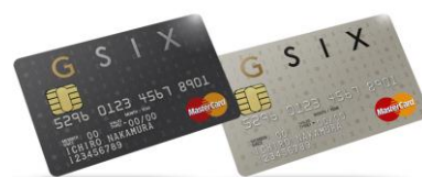
「GINZA SIX カード」イメージ

クレジット機能がついた「GINZA SIX カード」は、プレステージ(年会費50,000円/税抜)とゴールド(年会費5,000円/税抜)の二種類。GINZA SIX でのご利用時に、GINZA SIX で使えるポイントを付与します。また、誰でも無料でダウンロードできる「GINZA SIX アプリ」でも会員登録によりポイントをためることができます。