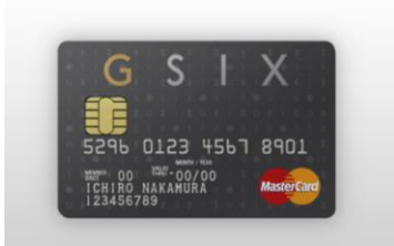
<GINZA SIX カード プレステージ>

クレジット機能付き「GINZA SIX カード」は、プレステージ(年会費 50,000 円/税抜)とゴールド(年会費 5,000 円/税抜)の2種類です。GINZA SIX でのご利用時に、GINZA SIX で使えるポイントを付与するほか、入会特典としてプレミアムラウンジ「LOUNGE SIX」ご招待券をもれなく進呈、そのほかにもカードの種類やご利用額に応じて、プレミアムなサービスをご用意しています。また、「GINZA SIX アプリ」との併用で獲得ポイントがさらにお得になります。その他、Mastercard®コンシェルジュ、国内・海外空港ラウンジサービス等も付帯サービスとしてご提供します。(詳細は別紙「参考資料 - 1」参照)