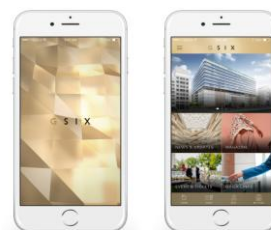
「GINZA SIX アプリ」イメージ

GINZA SIX アプリはそのほかにも多彩な機能を備え、日本初導入の仕組みにより館内ナビゲーション、店舗検索、レストラン予約および駐車場の満空情報配信などでGINZA SIX におけるお買い物を、より快適にサポートします。また、GINZA SIX の最新ニュースだけでなく、GINZA SIX が厳選した国内外の最新ニュースもお届けする、毎日活用できるアプリです。