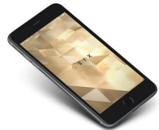
<GINZA SIX アプリ>

アプリのアートディレクションは、数多くの国内外のファッションブランドのWEBデザイン等の実績を持つ「SIMONE(シモーネ)」( http://www.ilovesimone.com/ )、アプリ開発は、オーストラリアに本社を構え、UX を中心としたアプローチで国内外に優れた実績を持つ「Tigerspike(タイガースパイク)」( https://tigerspike.com/ )が担当し、スタイリッシュかつ機能性に優れたアプリを開発しました。