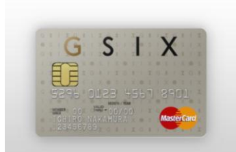
<GINZA SIX カード ゴールド>