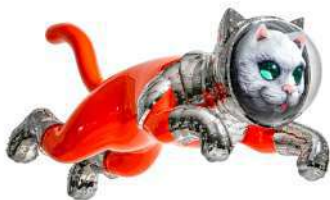
SHIP'S CAT (Flying)

「SHIP'S CAT」とは、大航海時代に長い航海に乗船した「船乗り猫」のこと。宇宙を航海する未来の希望を予兆し、安全や出会いを助ける守り神となって、混迷する世界においても、人々や若者の旅を導いて欲しいという願いが込められています。