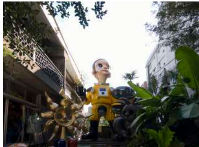
Sun Child No.1 (2011)

2022年に開館した大阪中之島美術館のために制作された「SHIP'S CAT」シリーズの彫刻作品。