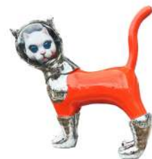
SHIP'S CAT (ONK-1)