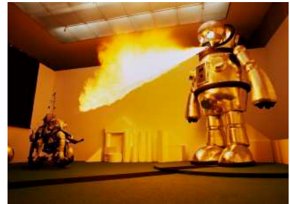
Giant Torayan (2005)

右手に持つ「太陽」は、岡本太郎の「太陽」をテーマにした作品群から魂とデザインを受け継いでいる。