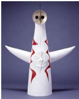
太陽の塔 Tower of the Sun (1/50)

岡本太郎記念館のご協力のもと、1970年の大阪万博のテーマ館として作られた「太陽の塔」の1/50サイズの原型模型を展示予定です。