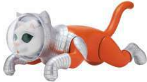
SHIP'S CAT (Flying) Figure mascot