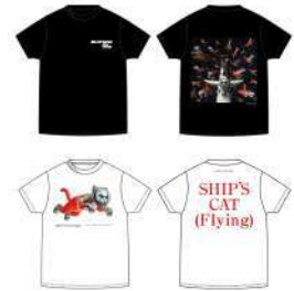
SHIP'S CAT T-shirt

SHIP'S CAT をモチーフにしたミニサイズフィギュア。小さいながら細かい部分まで再現しています。※ブラインドカプセルでの販売となります。