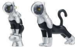
カプセルトイ AIP SHIP'S CAT Ver1.5