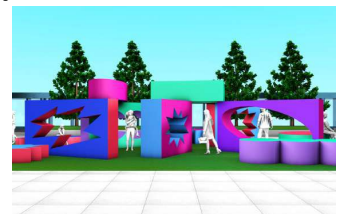
ROOFTOP ART PARK イメージ