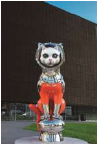
SHIP'S CAT (Muse) (2021)

1965年、大阪生まれ。1990年代初頭より、「現代社会におけるサヴァイヴアル」をテーマに機能性を持つ大型機械彫刻を制作。ユーモラスな形態に社会的メッセージを込めた作品群は国内外から評価が高い。2017年、「船乗り猫」をモチーフにした、旅の守り神「SHIP'S CAT」シリーズを制作開始。2022年に開館した大阪中之島美術館のシンボルとして「SHIP'S CAT (Muse) (2021)」が恒久設置される。