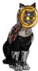
SHIP'S CAT (Crew/Black)