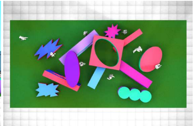
ROOFTOP ART PARK イメージ