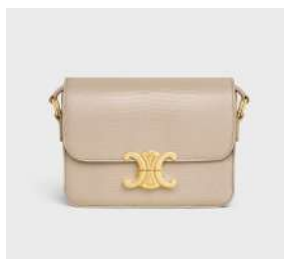
ティーン トリオンフ 税込 1,100,000 円