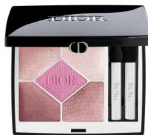
ディオールショウ サンク クルール 853 D-フローラル 税込 9,570 円