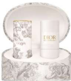
ディオール ルージュ プレミエ コンプリート 全12色 税込 83,600 円 リフィル 全12色 税込 8,800 円