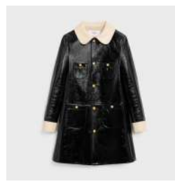
ペビードール バイカラーコート 税込 825,000 円