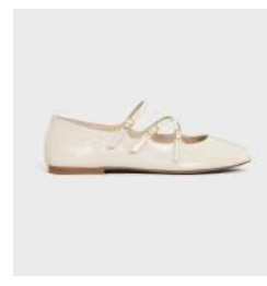
クリスクロスベビーズ バレリーナ 税込 132,000 円