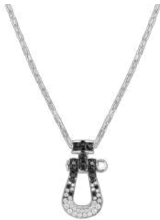
フォース10 ネックレス XL モデル 18K WG、ホワイトダイヤモンド、ブラックダイヤモンド 税込 2,112,000 円