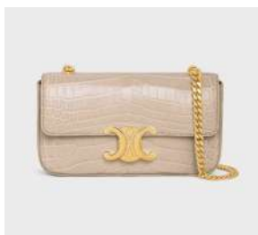
チェーン ショルダー クロード 税込 3,300,000 円