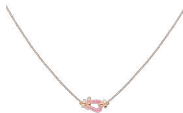
フォース10 ネックレス スモールモデル 18K PG、ピンクサファイア 税込 286,000 円