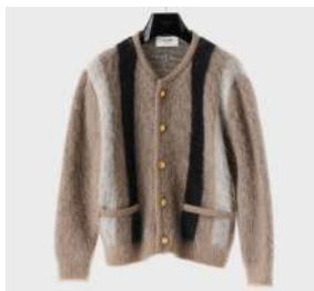
カーディガンジャケット 税込 467,500 円